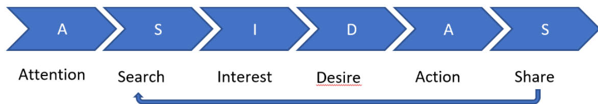
Abbildung 2 ASIDAS-Modell.

Für beide Generationen – Y und Z – hat sich in der Theorie herausgestellt, dass Social Media und Influencer Kaufentscheidungen mehr beeinflussen, als es traditionelle Medien könnten. In der Empirie konnte jedoch nicht bestätigt werden, dass Konsumenten auch den Kauf über den Werbekanal des Influencers tätigen. Somit müsste überprüft werden, an welchen Stellen und in welchen Phasen der Customer Journey konkret, in welcher Form und in welchem Ausmaß eine Beeinflussung stattfindet. Für diese Studie wurde die Customer Journey nach McKinsey als theoretische Fundierung gewählt und auf die Phasen Awareness (Aufmerksamkeit), Consideration (Abwägung) und Purchase (Aktion) konzentriert. Ein Ansatzpunkt wäre, hier ein anderes Modell heranzuziehen, welches der Dynamik von sozialen Medien gerechter wird. In diesem Zusammenhang wird das ASIDAS-Modell für eine Anschlussstudie vorgeschlagen.