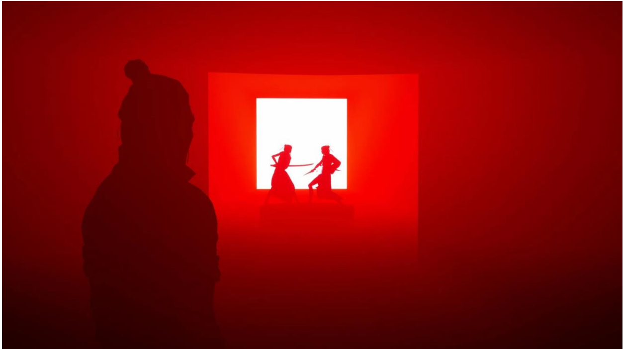
Abb. 5: Abstrakte und mitunter surrealistische Ästhetik dient der Psychologisierung der Gegner:innen in Sifu (eigener Screenshot).

Spielmechanisch hebt sich Sifu vor allem aufgrund seiner Alterungsmechanik von anderen Genrevertretern ab. Nach jeder Niederlage kehrt der/die Protagonist:in mit Hilfe des Amuletts ins Leben zurück, altert dabei jedoch sichtbar. Kumulative Tode staffeln den Alterungssprung hoch. Der erste Tod erhöht das Alter um ein Jahr, der zweite um zwei usw. Zwar lässt sich die Todeszählung durch besiegte Gegner:innen reduzieren, rückgängig machen lässt sich das Altern jedoch nicht 10 .