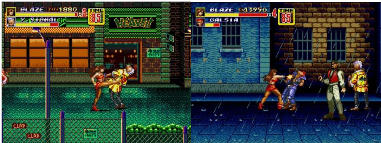
Abb. 1 und 2: Im ersten Level kämpfen sich Spieler:innen (hier mittels Charakter Blaze Fielding) durch aggressive Gegner:innenhorden vor Großstadtkulisse inklusive Hinterhof im Regen.

Nimmt man eine kulturwissenschaftliche Perspektive ein, offenbart sich darin ein hochrelevanter Mechanismus: Digitale Spiele spiegeln nicht nur kulturelle Diskurse, sondern transformieren und perpetuieren sie. Beat 'em ups , als eines der frühesten Genres digitaler Gewaltinszenierung, bieten ein paradigmatisches Beispiel für die ludische Bearbeitung kultureller Ängste und Imaginationen urbaner Dekadenz. Streets of Rage 2 reproduziert und funktionalisiert urbane Gewaltbilder, indem es soziale Krisenästhetik in rhythmisch strukturierte Gewaltdulissen überführt; diese Form der Darstellung trägt langfristig zur Stabilisierung kultureller Narrative bei: Städte werden als Orte des Verfalls, der Anonymität und der Gewalt inszeniert, wobei Gewalt nicht hinterfragt, sondern als beinahe natürliche Reaktion auf urbane Zustände dargestellt wird.