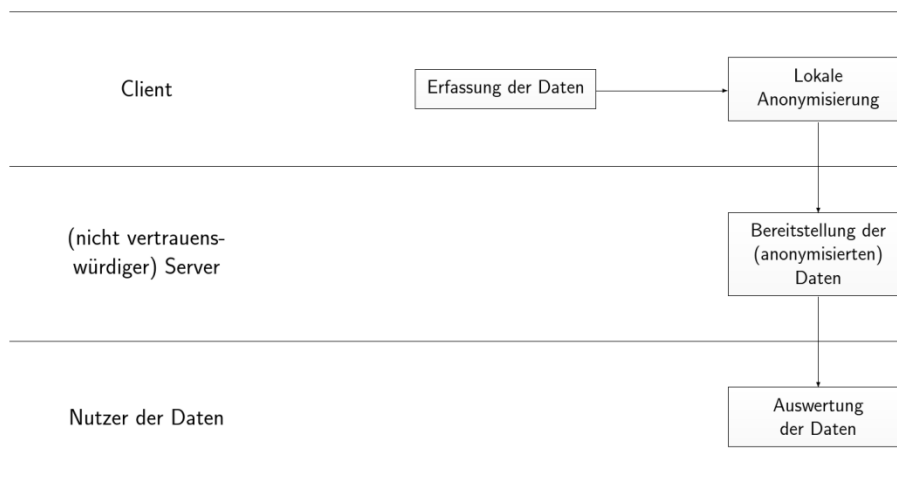
Abbildung 4: Anonymisierungsszenario 3: ohne Treuhänder, Anonymisierung beim Client